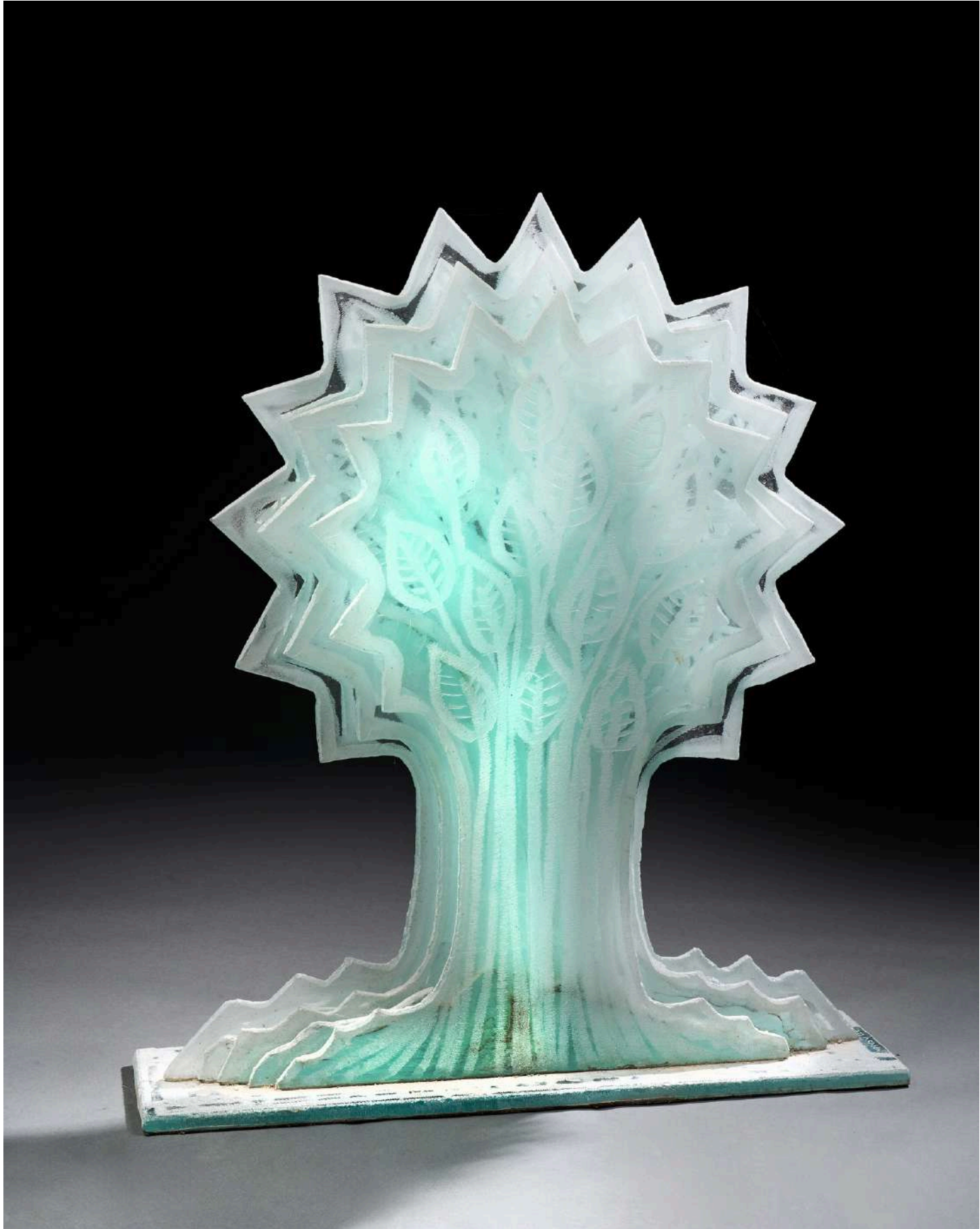
L'arbre de vie, 2021, verre découpé, sablé, gravé, 85x74x15cm